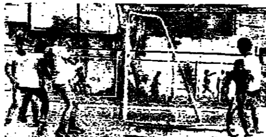
لحظة من مباراة الانصار والزمالة امام برسي الزمالة

تبل الضاع - وطلع مبتولي بكرة مقلدة ، نطفي بها الدفاع لكها خلقت من قبل الحارس محبوب - وطلقة من قاسم حزمة ، قطنها الحارس... وطلقة سرية من هجوم الشبيبة وخرج الحارس لثلاثة الكرة ارتدت من ولاعب دفاعه . الانسار بكرة مقلدة ، نطفي بها الدفاع لكها خلقت من قبل الحارس محبوب - وطلقة من قاسم حزمة ، قطنها الحارس... وطلقة سرية من هجوم الشبيبة وخرج الحارس لثلاثة الكرة ارتدت من ولاعب دفاعه . الانسار بكرة مقلدة ، نطفي بها الدفاع لكها خلقت من قبل الحارس محبوب - وطلقة من قاسم حزمة ، قطنها الحارس... وطلقة سرية من هجوم الشبيبة وخرج الحارس لثلاثة الكرة ارتدت من ولاعب دفاعه .